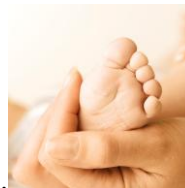
(prsty u nohou).....