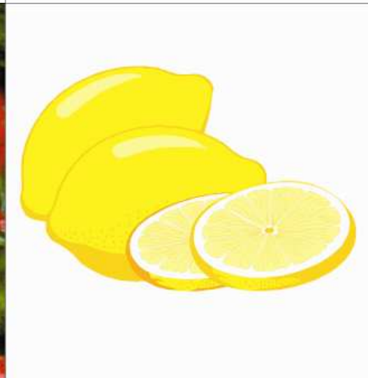
CITRONY citrony citrony