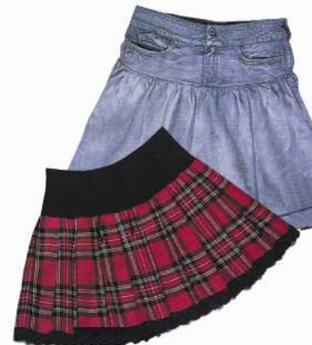
SUKNĚ sukně sukně