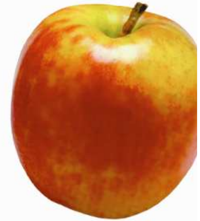
JABLKO jablko jablko