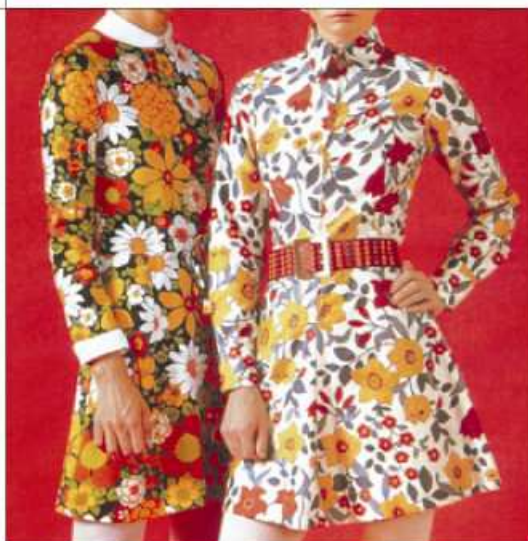
ŠATY šaty šaty