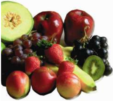
OVOCE ovoce ovoce