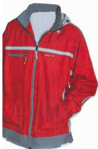
BUNDA bunda bunda