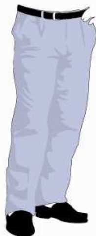
KALHOTY kalhoty kalhoty