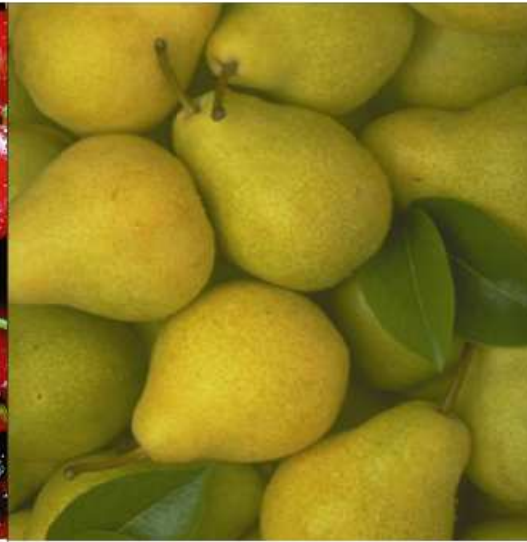
HRUŠKY hrušky brušky