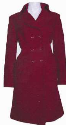
KABÁT kabát kabát