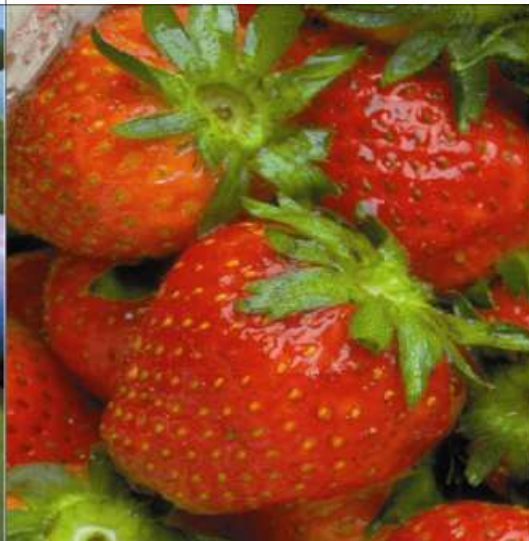
JAHODY jahody jabody