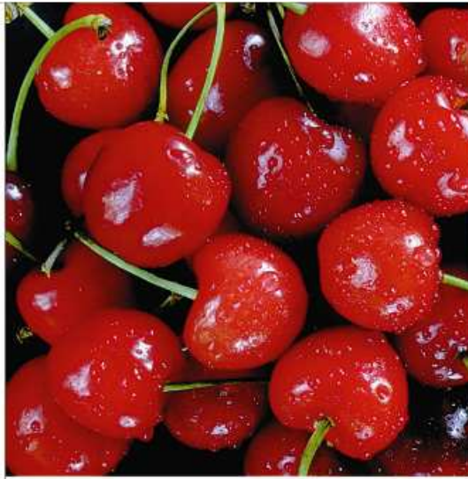
TŘEŠNĚ třešně třešně