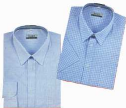
KOŠILE košile košile