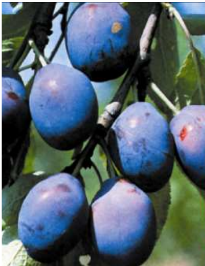
ŠVESTKY švestky švestky