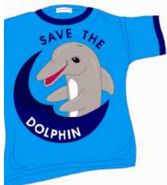
TRÍČKO tričko tričko