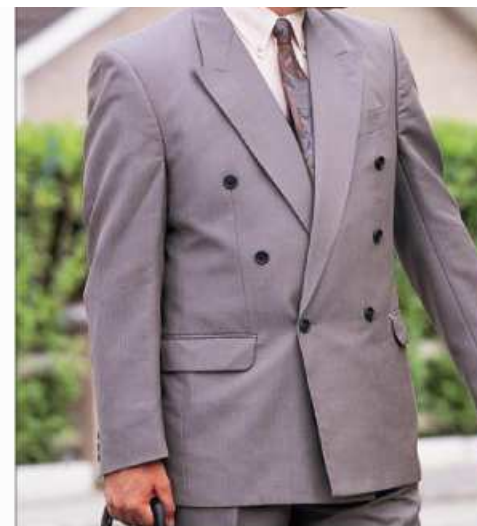
SAKO sako sako