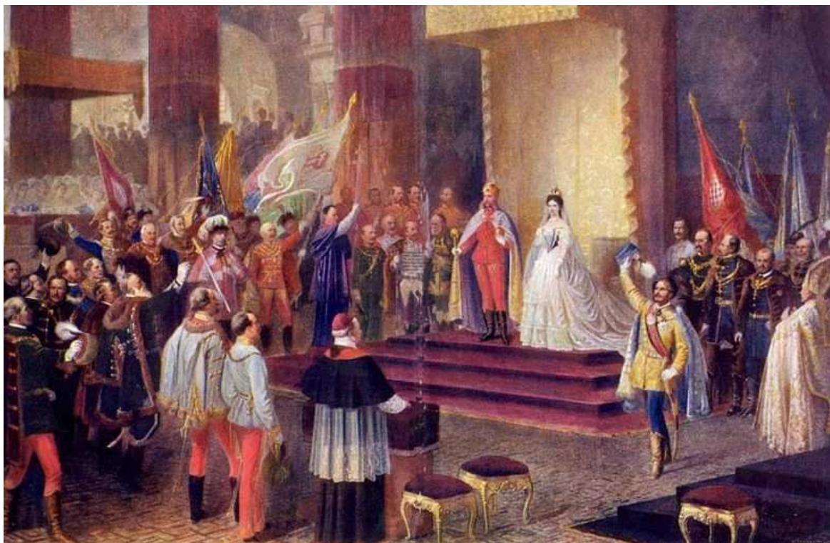
Slavnostní korunovace Františka Josefa I. na uherského krále

Ve snaze zabránit rozpadu monarchie se rakouský ministerský předseda přiklonil k myšlence DUALISMU , rozdělení říše na dvě části.