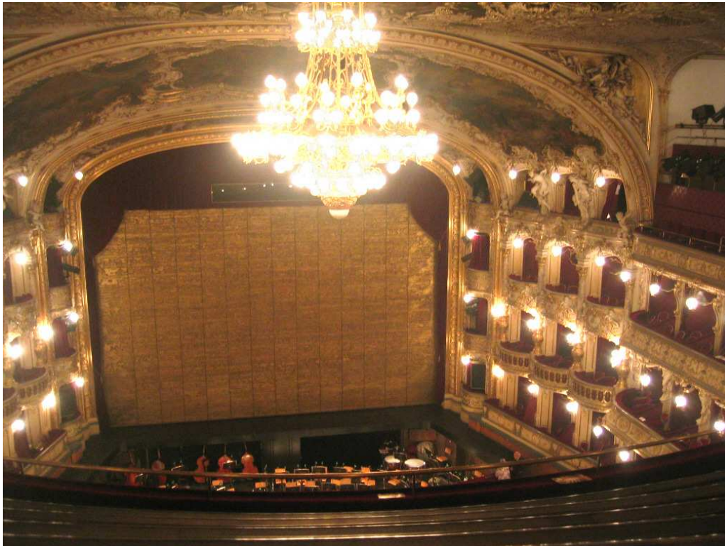
Státní opera v Praze

Opera spojuje divadelní představení s hudbou.