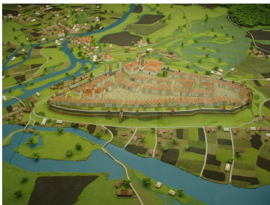
model středověkého města Hradce Králové

http://cs.wikipedia.org/wiki/Soubor:Model_st%C5%99edov%C4%9Bk%C3%A9ho_HK_1.JPG , volné dílo