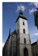
kostel sv. Jakuba