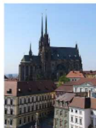
Katedrála sv. Petra a Pavla