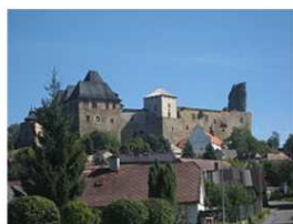
Lipnice nad Sázavou