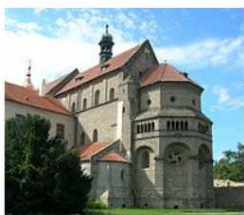
Bazilika sv. Prokopa

Poznáš, co je na obrázku? Přiřaď správný název.