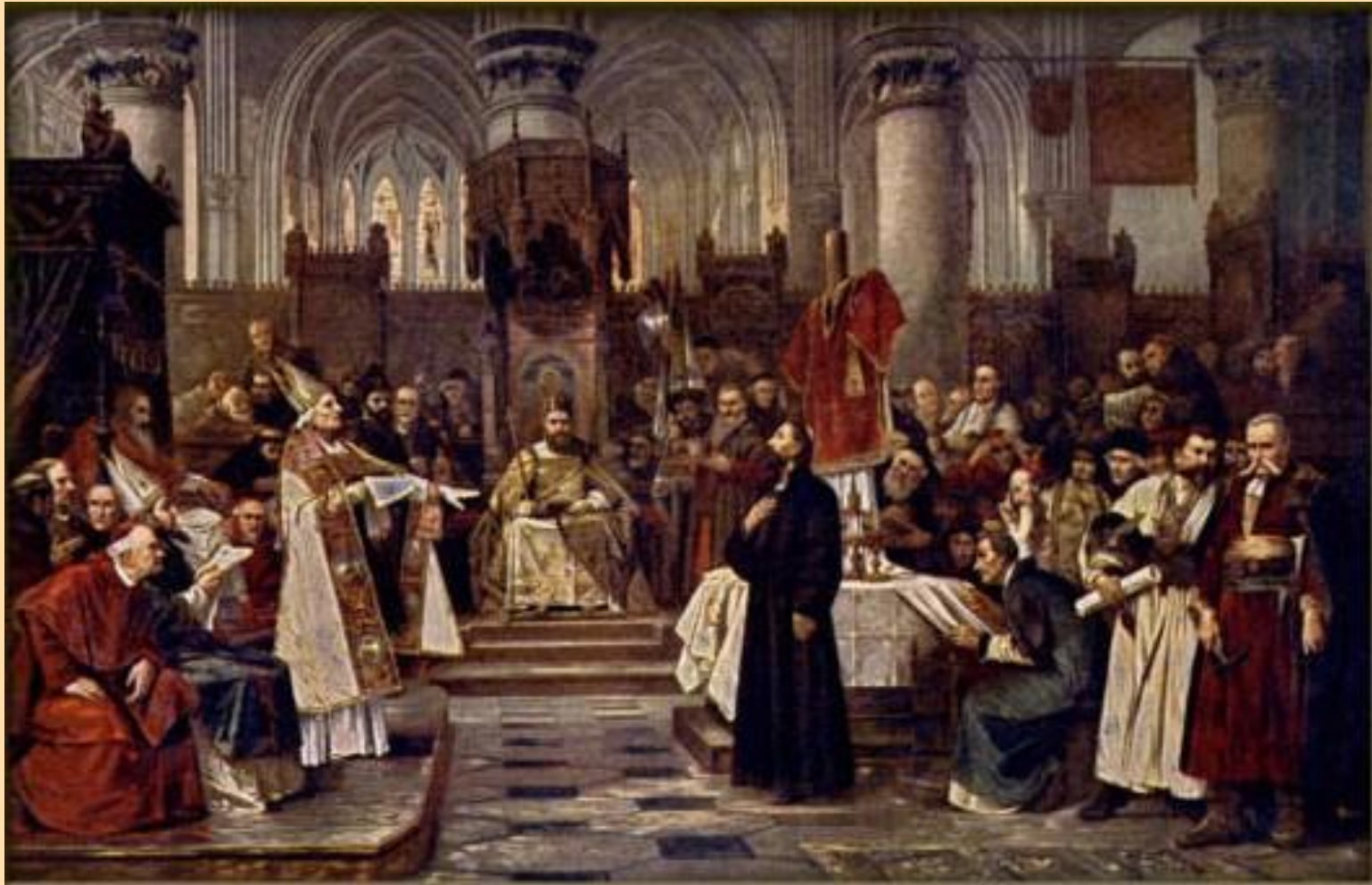
Jan Hus před koncilem v Kostnici