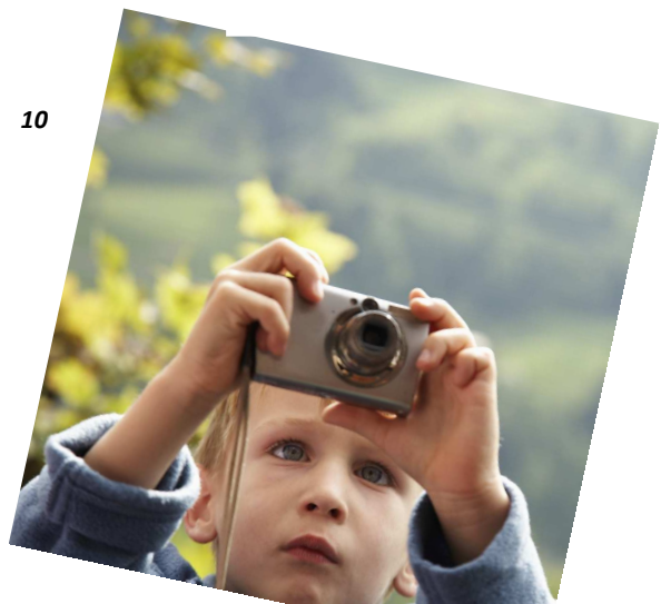
John ..... very good photographs.