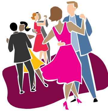
They ..... at the school party.