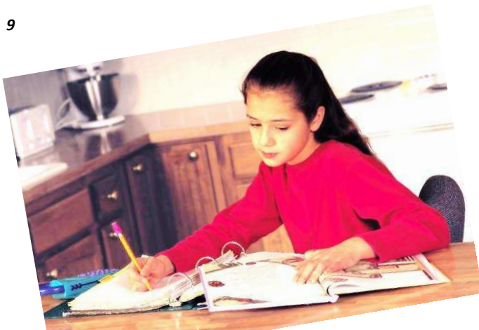
I ..... my homework.