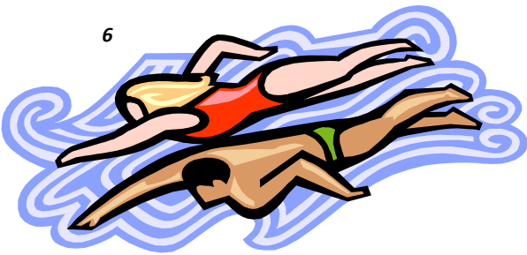
My parents ..... in the pool.