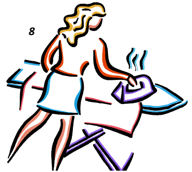
Viola ..... the clothes.