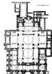
Bazilika svatého Marka (Benátky)