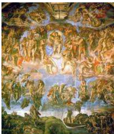
Poslední soud (čelní strana)