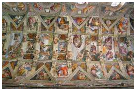
Sixtinská kaple – Biblické výjevy (strop)