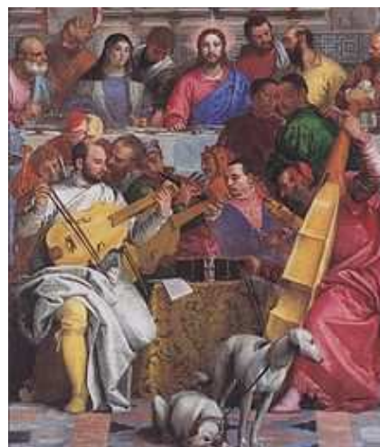
Veronese: Svatba v Káně galilejské