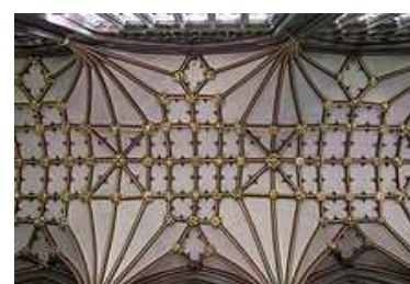
gotická síťová klenba