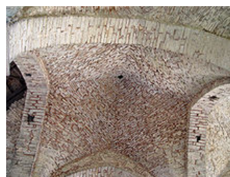
románská křížová klenba