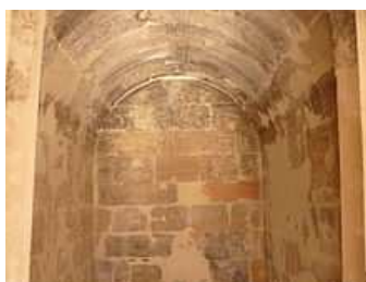
nejstarší valená klenba – sumerská

Klenba je vodorovná samonosná stavební konstrukce, která se užívá na zakrytí nějakého prostoru. Podobně jako oblouk využívá toho, že váha klenby se přenáší na její podpory.