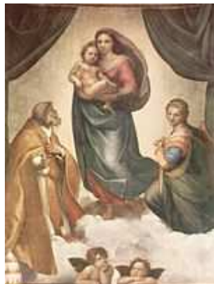
Raffael: Sixtinská Madonna

Další z trojlístku nejvýznamnějších umělců renesanční Itálie je Raffael Santi , malíř fresek a četných obrazů Madon. Na sklonku renesance vynikli tři malíři z Benátek : Tizian , Veronese a Tintoretto . Jejich obrazy najdeme i v našich galeriích v Praze, Bratislavě, Kroměříži.