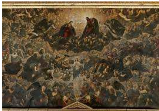
Tintoretto: Ráj ( největší olejomalba )