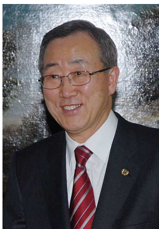
Ban Ki moon – generální tajemník OSN

Organizace spojených národů (OSN) - anglicky United Nations Organizations- je vedle Evropské unie další mezinárodní organizací. Předcházela jí Společnost národů, která jako záštita kolektivní bezpečnosti a mírového řešení konfliktů neobstála.