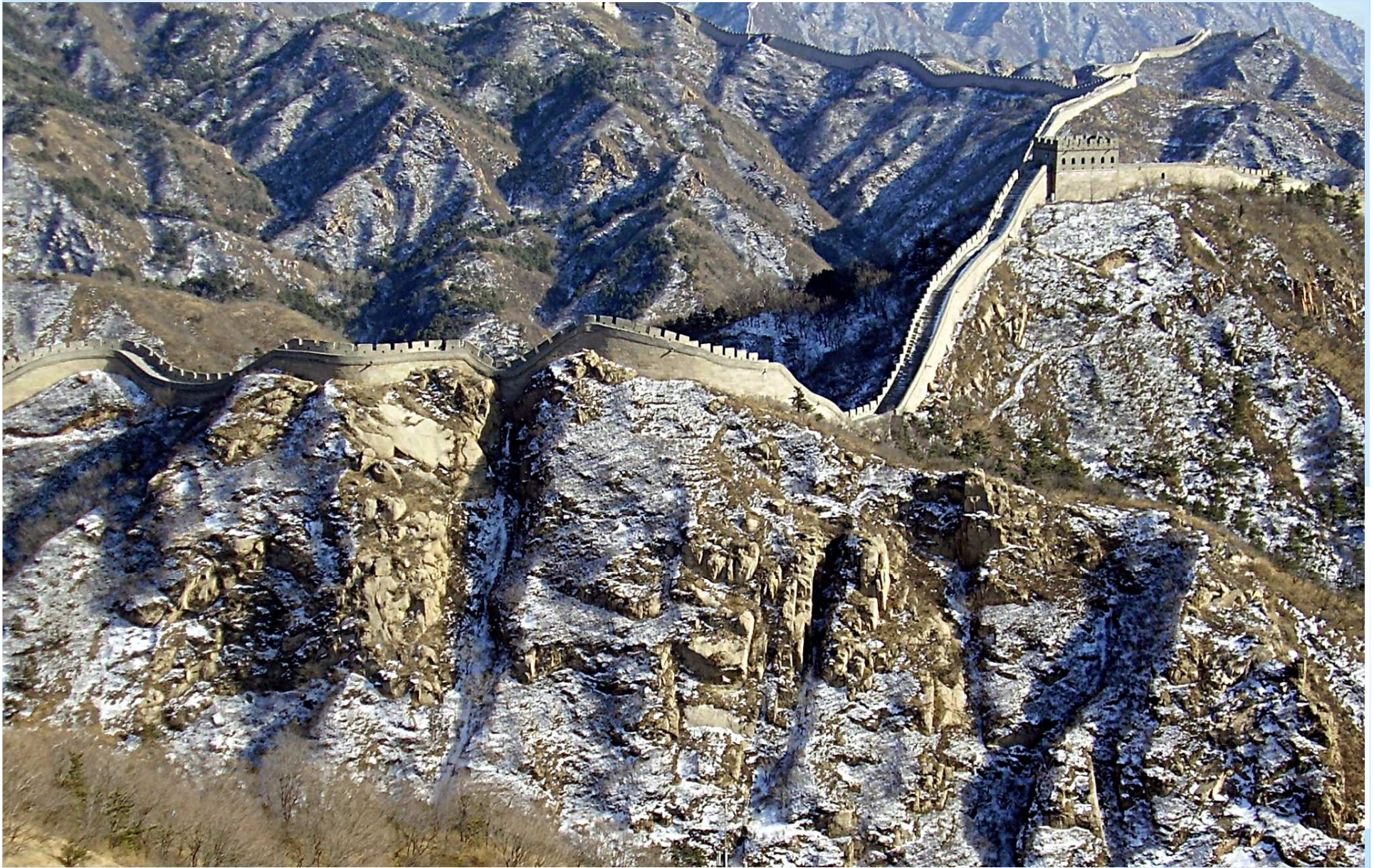
Velká čínská zeď