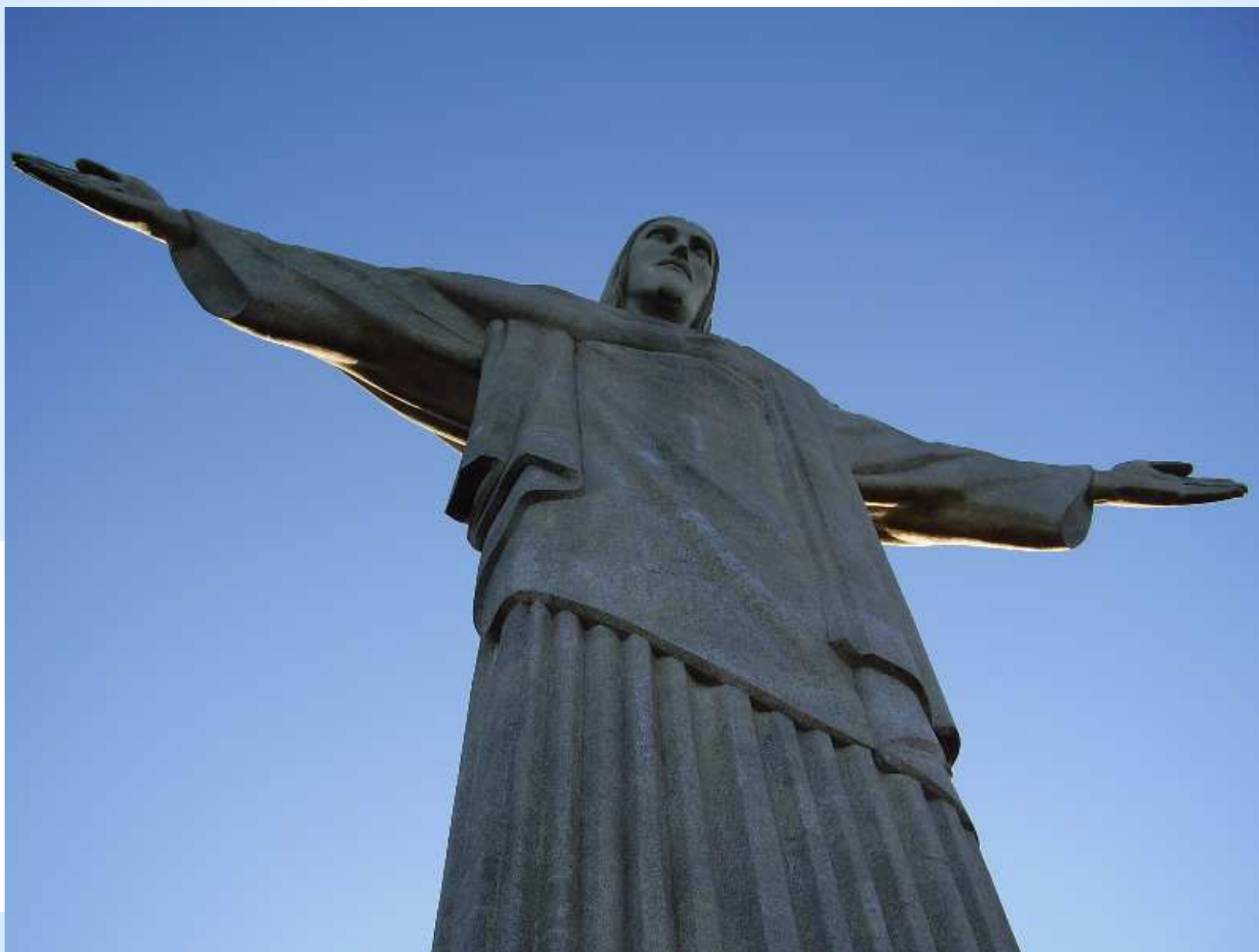
Socha Krista Spasitele