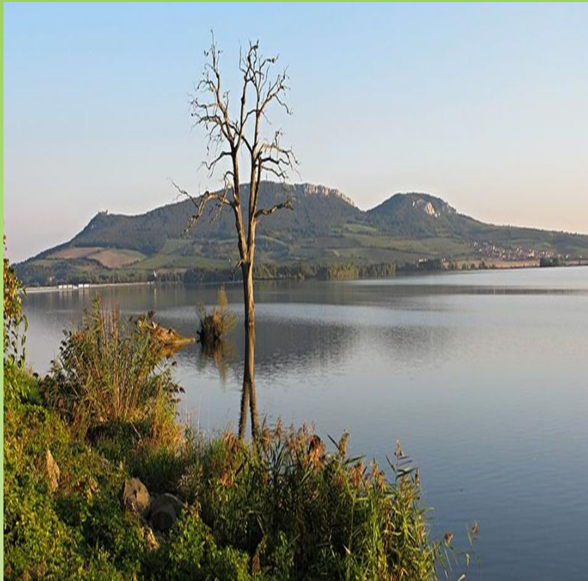
Nádrž Nové Mlýny