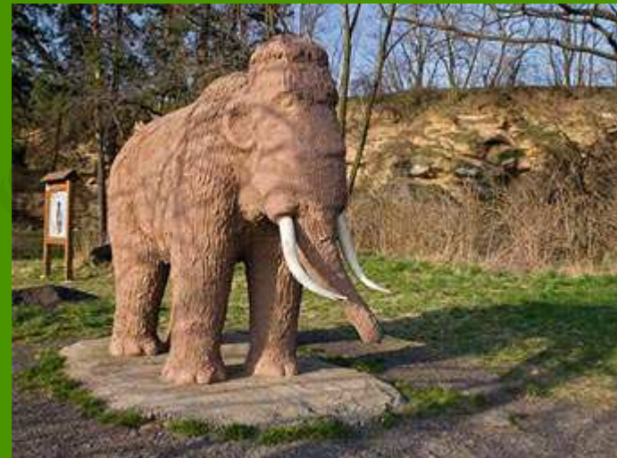
Mamutík Tom v Předmostí