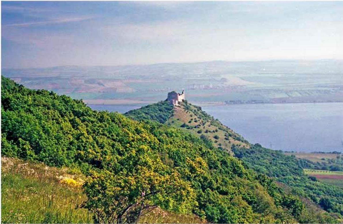
Zřícenina hradu Děvičky z úbočí Děvína