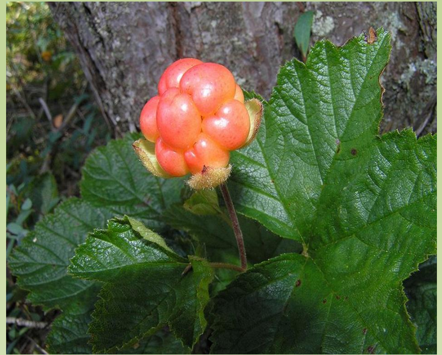
plod ostružiníku morušky