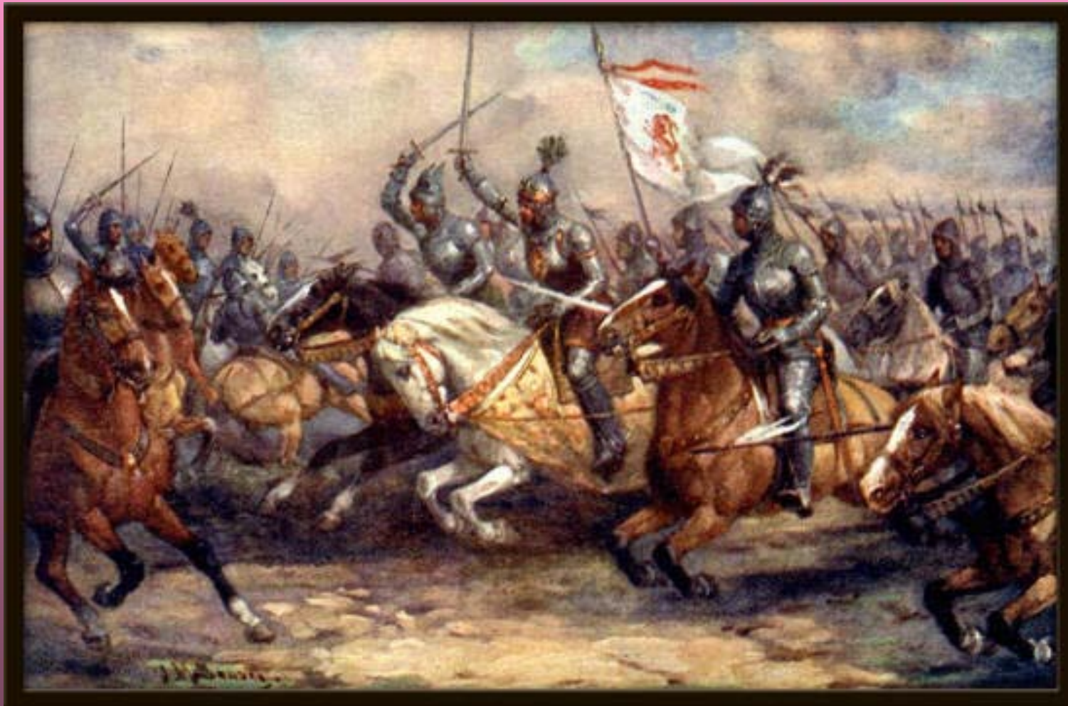
(„Historie českého národa v obrazech“, Josef Mathauser)

Král nechal svého koně upoutat mezi koně svých dvou rytířů, kteří ho zavedli do nejprudší bitevní vřavy.