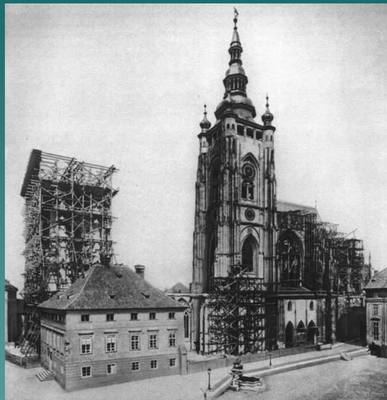
Rozestavěný chrám v r. 1887