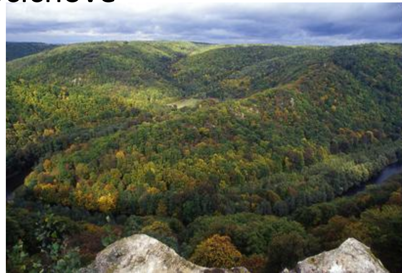
Údolí Dyje u Ledových slují