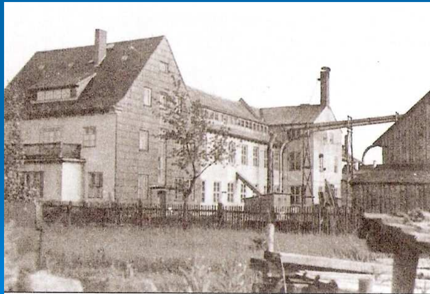
Englova továrna 1946

Znárodněny velké továrny, doly, hutě a banky → staly se majetkem státu