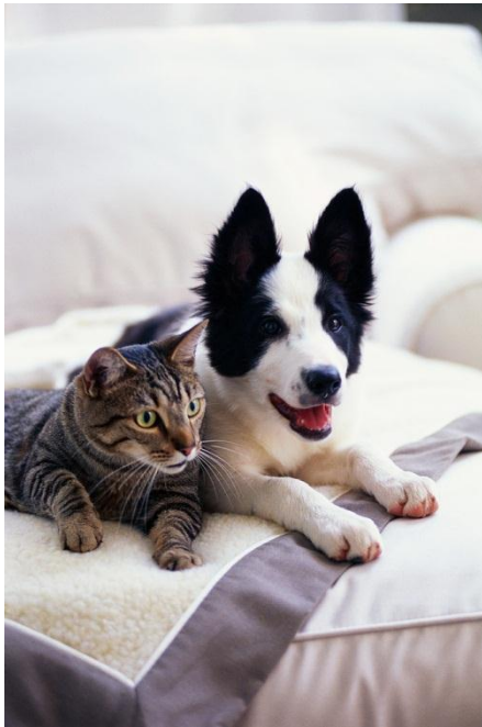
kočka a pes