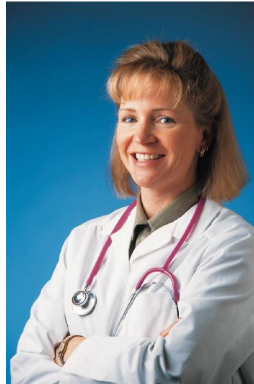
lékař - služba