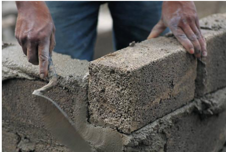
zedník - výroba

Lidé mají různá zaměstnání . Pracují buď ve službě nebo ve výrobě.