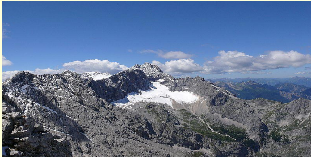
Nejvyšší hora-Zugspitze v Alpách