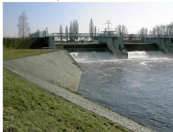
Jez České Vrbné